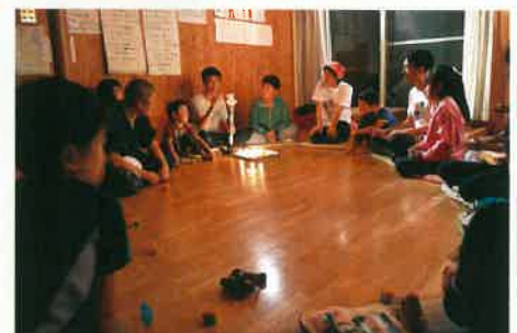
8/22-24 キャンプ2日目夜キャンドルトーク

8月は大人・子ども10名ずつが参加の大所帯。ぐずつく天候でしたが、雨対策（四足テントやブルーシートによる可動式屋根の設置）のおかげで、調理・食事もスムーズに。2日目は温泉にも行って、みんなポカポカになりました。私は2回とも、子どものキャンドルトークに参加しましたが、子どもたちが深い悲しみを抱えていることをあらためて実感し、安心して遊び、語れる場を作ることの大切さを感じるひと時でした。 2015/10/31